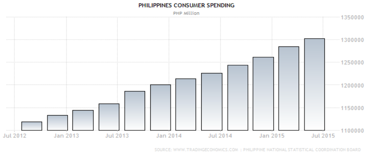
แผนภูมิที่ 2 แสดงอัตราการใช้จ่ายของคนฟิลิปปินส์

จากอัตราการเจริญเติบโตเฉลี่ยปีละกว่าร้อยละ 20 ของธุรกิจ BPO ทำให้ตัวเลขผลิตภัณฑ์มวลรวมภายในประเทศสูงขึ้น และส่งผลให้เงินหมุนเวียนภายในประเทศก็สูงขึ้นตามไปด้วย นอกจากนี้ อัตราการใช้จ่าย การซื้อขาย การค้า การลงทุน ก็มีมากขึ้นเช่นเดียวกัน โดยจากปี 2555 - 2558 พบว่าการใช้จ่ายของผู้บริโภคเพิ่มขึ้นจาก 1.1 ล้านล้านเปโซ เป็น 1.3 ล้านล้านเปโซ และยังมีแนวโน้มจะสูงขึ้นอย่างต่อเนื่อง โดยสาเหตุหนึ่งของการใช้จ่ายใช้สอยของผู้บริโภคที่มากขึ้น ก็เนื่องมาจากรายได้ของอุตสาหกรรม BPO นั้นเอง