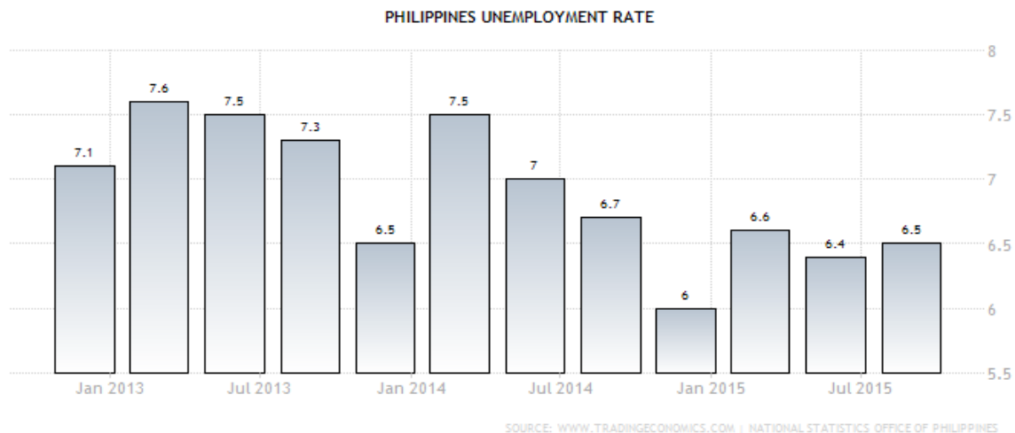
แผนภูมิที่ 3 แสดงอัตราการว่างงานที่ลดลงของประชาชนชาวฟิลิปปินส์

จากการที่อุตสาหกรรม BPO มีแนวโน้มการขยายตัวเพิ่มมากขึ้นเรื่อยๆ ทำให้เกิดอัตราการจ้างงานเพิ่มขึ้นตามไปด้วย โดยเฉพาะตำแหน่งเจ้าหน้าที่บริการลูกค้า ทั้งทางอินเทอร์เน็ตและทางโทรศัพท์ ส่งผลให้อัตราการว่างงานของประเทศลดลงตามลำดับ