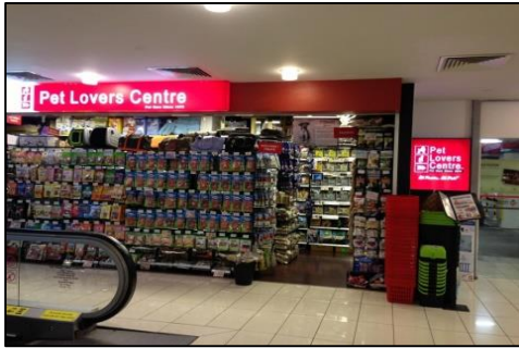
Pet Lovers Centre, Somerset,

(Society for the Prevention of Cruelty to Animals : SPCA) นอกจากนี้ บริษัทที่เกี่ยวข้องในธุรกิจนี้ ให้ ความเห็นต่างๆ ดังนี้