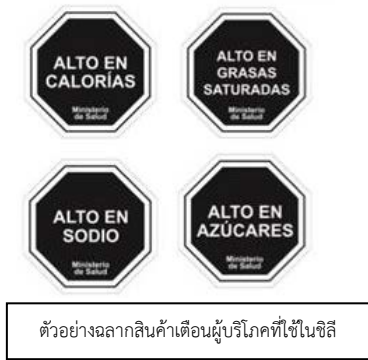
ตัวอย่างฉลากสินค้าเตือนผู้บริโภคที่ใช้ในชิลี

ถึงแม้ว่ารัฐบาลแคนาดาจะเป็นประเทศแรกในกลุ่ม NAFTA ที่ริเริ่มส่งเสริมมาตรการการบังคับใช้ฉลากเตือนผู้บริโภคบนสินค้าอาหาร (กับสินค้าที่ก่อให้เกิดโรคอ้วน) แต่แคนาดาไม่ใช่ประเทศแรกของโลก ที่เห็นความสำคัญและใช้มาตรการดังกล่าว ในปี 2559 ประเทศชิลีเป็นประเทศแรกของโลกที่ได้มีประกาศใช้กฎระเบียบฉลากสินค้าเตือนผู้บริโภค ที่บังคับให้ผู้ผลิตจะต้องมีการระบุฉลากเตือนสินค้าที่มีปริมาณแคลอรีสูง รวมถึงสารไขมัน น้ำตาล และโซเดียม ในระดับสูง ทั้งนี้การเจรจาในรอบ NAFTA 2.0 แคนาดาและเม็กซิโกอาจใช้มาตรการดังกล่าวเป็นเครื่องต่อรองในการเจรจากับสหรัฐฯ ซึ่งไม่ว่าผลจะออกมาเป็นอย่างไร แคนาดาได้ดำเนินการประกาศใช้กฎระเบียบฉบับใหม่นี้ ซึ่งผู้ประกอบการไทยควรให้ความสำคัญ โดยเฉพาะสินค้าที่ไม่ดีต่อสุขภาพ (Unhealthy Food) ที่มีปริมาณน้ำตาล ไขมัน และโซเดียมที่สูงนั้น ควรพิจารณาปรับเปลี่ยนสูตรสินค้าให้เป็นสินค้าที่ Healthy มากขึ้น เพราะผลการบังคับฉลากเตือนผู้บริโภคนั้น อาจส่งผลให้ผู้บริโภคตระหนักถึงสุขภาพมากขึ้นและหันไปบริโภคสินค้าประเภทอื่นแทน หรือจากคู่แข่ง