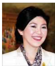
นางสาวยิ่งลักษณ์ ชินวัตร

โดยเฉพาะอย่างยิ่งโครงการทำเรื่อน้ำลึกจำวผิว และท่าเรือที่ทวาย และเป็นที่ยูู้ ๆ กันว่า ท่าเรือทวายได้กลายมาเป็นนโยบายลำดับต้น ๆ ของรัฐบาลนางสาวยิ่งลักษณ์ ชินวัตรของไทยไปแล้ว