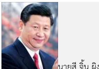
นายสี จิ้น ผิง

รัฐบาลจีนได้ให้ความสำคัญกับ โครงการนี้มาก ได้ทุ่มทุนและให้ความ ช่วยเหลือแก่เมียนมาร์มากมาย ในหลาย โครงการ เพื่อปูทางไปสู่ความร่วมมือทาง ธุรกิจ โดยโครงการท่าเรือเจียวเพียวนี้ เริ่มต้นเดินหน้า ตั้งแต่ปี ๒๕๕๒ หลังจากที่ นายสี จิ้นผิง ผู้นำรุ่นใหม่ของจีนเดินทาง ไปเยือนพม่าและลงนามสัญญาเอ็มโอยู ในเรื่องการขุดเจาะก๊าซธรรมชาติและ การจัดการท่อก๊าซ โดยจีนลงทุนกว่า ๙ พัน ล้านดอลลาร์สหรัฐฯ ในปี ๒๕๕๔ สำหรับ โครงการนี้ ทำให้จีนกลายเป็นนักลงทุน ต่างประเทศรายใหญ่ที่สุดของเมียนมาร์