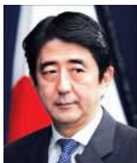
นายชินโซะ อาเบะ

การเดินทางไปเยือนมาร์ของ นายกรัฐมนตรีหญิงของไทยเพื่อพบกับ ประธานาธิบดี เต็ง เส่ง นั้นมีบทสรุปว่า ทั้ง ๒ ประเทศควรจะต้องตั้งประเทศที่ ๓ เข้า มาร่วมเพื่อทำให้โครงการท่าเรือทวาย ประสบความสำเร็จง่ายขึ้น โดยมุ่งที่ ประเทศญี่ปุ่น