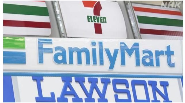
ร้านสะดวกซื้อ 3 รายใหญ่ในญี่ปุ่น: 7-ELEVEN / FamilyMart / LAWSON

หากพิจารณาผลประกอบการของร้านสะดวกซื้อ 3 รายใหญ่ในญี่ปุ่นซึ่งครองส่วนแบ่งตลาดเกินกว่าร้อยละ 90 ในช่วง 3 เดือนตั้งแต่เดือนมีนาคมถึงพฤษภาคมที่ผ่านมา จะเห็นว่ามียอดขาย และผลกำไรสูงขึ้นเมื่อเทียบกับช่วงเดียวกันในปีก่อนหน้า โดย 7-ELEVEN Japan เพิ่มขึ้นร้อยละ 6 ในขณะที่ LAWSON เพิ่มขึ้นร้อยละ 8 และ FamilyMart เพิ่มขึ้นร้อยละ 13 ตามลำดับ ถึงแม้ว่ายอดขายจะยังน้อยกว่าเมื่อช่วง 2 ปีก่อนหน้าก่อนการแพร่ระบาดของเชื้อไวรัสโคโรนาสายพันธุ์ใหม่ หรือ โควิด-19 ก็ตาม แสดงให้เห็นถึงผลกระทบจากสถานการณ์โควิด-19 ที่ยังหลงเหลืออยู่ในปัจจุบัน