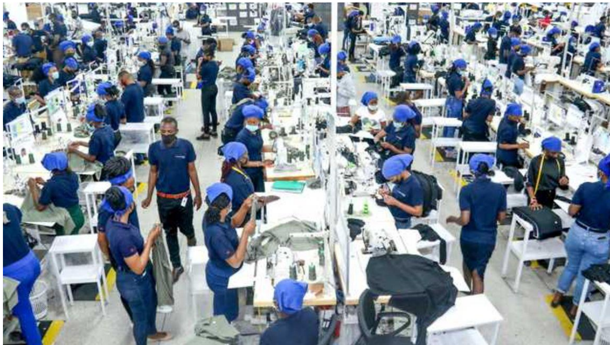
ภาพ: การผลิตสิ่งทอในโรงงานแห่งหนึ่งในเขตอุตสาหกรรมเพื่อการส่งออกในชานกรุงไนโรบี

ธนาคารสแตนดาร์ดชาร์เตอร์ดเปิดเผยการวิจัยของธนาคารในการประเมินธุรกิจภาคการส่งออกของเคนยาในอีก 10 ปีข้างหน้าว่า สินค้าเกษตร (ชาและกาแฟ) สิ่งทอ และการส่งออกแร่ธาตุต่างๆ จะเป็นสินค้าและภาคธุรกิจสำคัญในการสร้างรายได้ในการส่งออกให้กับประเทศเคนยาในช่วง 10 ปีต่อจากนี้