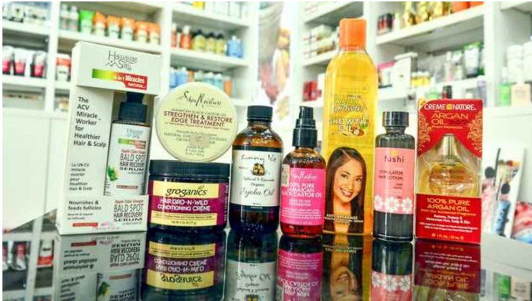
ภาพ: สินค้านำเข้าที่จะถูกคิดอัตรากำหนดสูงสุด ได้แก่ ผลิตภัณฑ์ดูแลเส้นผม พลาสติก กระดาษ และเฟอร์นิเจอร์

ผู้นำเข้าผลิตภัณฑ์ความงาม สิ่งทอ และยานยนต์ เข้ามายังประเทศเคนยาอาจต้องเผชิญกับอัตรากำหนดนำเข้าที่เพิ่มสูงขึ้น หากประเทศกลุ่มประชาคมแอฟริกาตะวันออก (East African Community – EAC) ตกลงตามนโยบายการใช้อัตรากำหนดเดียวกันที่จะเก็บสินค้านำเข้าจากประเทศที่มีใช้สมาชิกภาคี (Common External Tariff - CET) จากเดิมที่มีอัตรากำหนดสูงสุดอยู่ที่ร้อยละ 25 จะเพิ่มขึ้นเป็นร้อยละ 35 หลังจากที่มีข้อเสนอของผู้ผลิตสินค้าภายใน EAC หรือเคนยานำเสนอเข้าไปให้รัฐบาลเคนยานำไปใช้พิจารณาในการประชุมกลุ่มประชาคมแอฟริกาตะวันออก (East African Community – EAC) ต่อไป