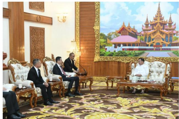
State Administration Council Chairman Prime Minister Senior General Min Aung Hlaing receives the delegation led by Thai Foreign Affairs Minister Mr Maris Sangiampongsa in Nay Pyi Taw yesterday.

February 23, 2025 Myanmar News Agency 208