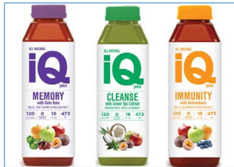
เครื่องดื่ม Botanical Beverage