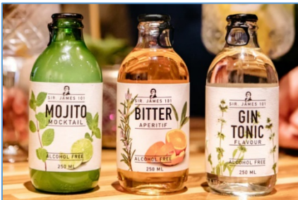
เครื่องดื่ม Mocktail Kombucha

เกิดจากหมักดอง เริ่มเป็นที่นิยมและกลายเป็นสินค้าหลัก (Mainstream Product) มากขึ้น รวมถึงเครื่องดื่มประเภท Probiotic Prebiotics หรือ Botanical Beverage ที่เทรนด์ของการห่วงใยสุขภาพได้ขยายไปยังตลาดเครื่องดื่มที่ผู้บริโภค ต้องการทางเลือกของสินค้าสุขภาพมากขึ้น