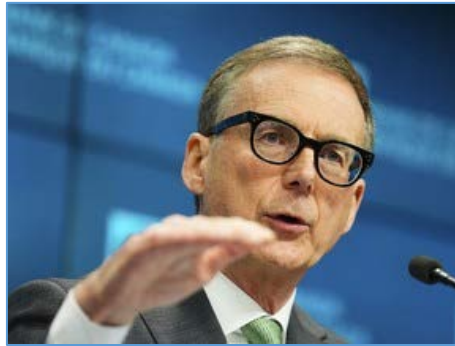
Mr. Tiff Macklem ผู้ว่าการธนาคารกลางแคนาดา

ตัวเลขเศรษฐกิจแคนาดาไตรมาสแรกของปี 2566 ขยายตัวที่ระดับร้อยละ 3.1 ซึ่งสูงกว่าเคยคาดการณไว้ที่ระดับร้อยละ 2.5 ได้สร้างความประหลาดใจให้กับนักวิเคราะห์ โดยตัวเลขล่าสุดแสดงถึงความแข็งแกร่งของเศรษฐกิจท่ามกลางอัตราเงินเฟ้อที่สูง นอกจากนี้ การประเมินตัวเลขเศรษฐกิจ โดยหน่วยงาน Statistics Canada ในเดือนเมษายน 2566 มีสัญญาณว่าเศรษฐกิจยังสามารถขยายตัวได้ที่ระดับร้อยละ 0.2 โดยตัวเลขล่าสุดได้สะท้อนถึงความยืดหยุ่น (Resilience) ของเศรษฐกิจแคนาดา ที่นักวิเคราะห์ต่างๆ ได้เคยคาดการณว่าแคนาดาจะได้รับผลกระทบเชิงลบจากอัตราดอกเบี้ยที่สูง และ Worst Case Scenario เศรษฐกิจแคนาดาอาจต้องเผชิญกับการถดถอยทางเศรษฐกิจเริ่มในไตรมาส 2 ของปี 2566