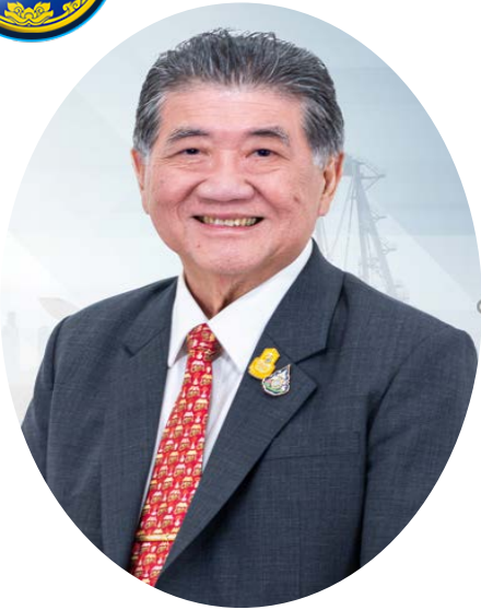
นายภูมิตร เวชชัย รองนายกรัฐมนตรี และ รัฐมนตรีว่าการกระทรวงพาณิชย์ (ประธานคณะกรรมการ)