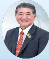
นายภูมิธรรม เวชยชัย รองนายกรัฐมนตรีและรัฐมนตรีว่าการกระทรวงพาณิชย์ (ประธานกรรมการ)