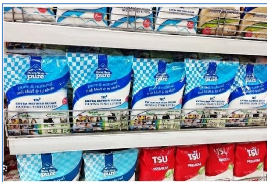
น้ำตาลจำหน่ายในซูเปอร์มาร์เก็ต

ตามที่สมาคมผู้ค้าปลีกเวียดนาม (Association of Vietnam Retailers: AVR) ระบุว่า ในปัจจุบันประเทศเวียดนามมีซูเปอร์มาร์เก็ตกว่า 1,000 แห่ง ศูนย์การค้า 240 แห่ง ร้านสะดวกซื้อ 6,700 แห่ง และตลาดดั้งเดิมกว่า 9,000 แห่ง สำหรับสินค้าน้ำตาล ช่องทางการจำหน่ายสินค้าส่วนใหญ่เป็นร้านตัวแทนจำหน่ายหรือร้านค้าของชำ ร้านสะดวกซื้อ ซูเปอร์มาร์เก็ต และช่องทางออนไลน์ โดยมีแนวโน้มว่าผู้บริโภคนิยมซื้อผลิตภัณฑ์ผ่านช่องทางออนไลน์มากขึ้น เนื่องจากสะดวกรวดเร็วและผู้บริโภคยังสามารถเปรียบเทียบข้อมูลและราคาสินค้าก่อนตัดสินใจซื้อได้ และร้านค้าออนไลน์มีระบบชำระเงินผ่านการเชื่อมโยงกับบัญชีธนาคาร หรือการชำระเงินสดเมื่อได้รับสินค้า