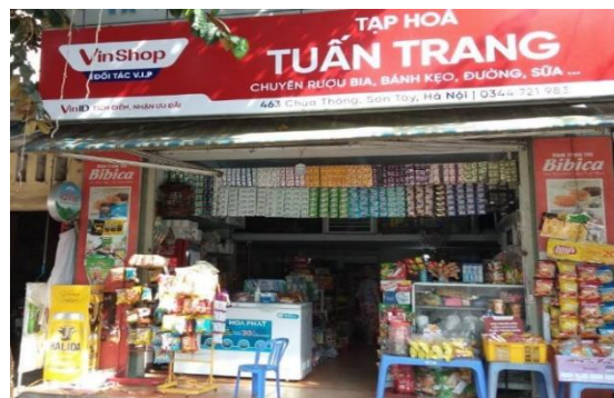
น้ำตาลจำหน่ายในร้านค้าของชำ