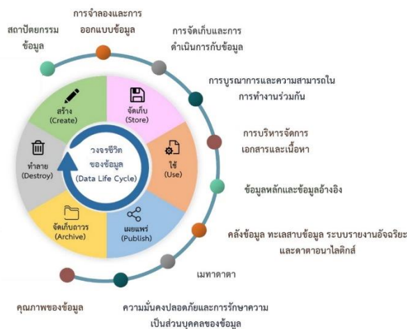
รูปภาพที่ 2 ระบบบริหารและกระบวนการจัดการข้อมูลหรือวงจรชีวิตของข้อมูลและองค์ประกอบในการบริหารจัดการข้อมูล

ระบบบริหารและกระบวนการจัดการข้อมูล หรือวงจรชีวิตของข้อมูล คือ “ลำดับขั้นตอนของข้อมูล ตั้งแต่เริ่มสร้างข้อมูลไปจนถึงการทำลายข้อมูล” ประกอบด้วย 6 ขั้นตอน ดังนี้