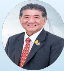
นายภูมิธรรม เวชยชัย รองนายกรัฐมนตรีและรัฐมนตรีว่าการกระทรวงพาณิชย์ (ประธานกรรมการ)